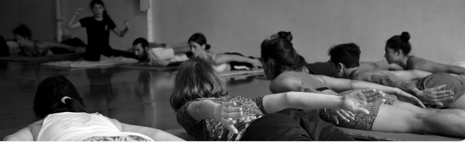
▲ Fotografía: NFCD - Naturaleza de la Fuerza en el Cuerpo y en la Danza