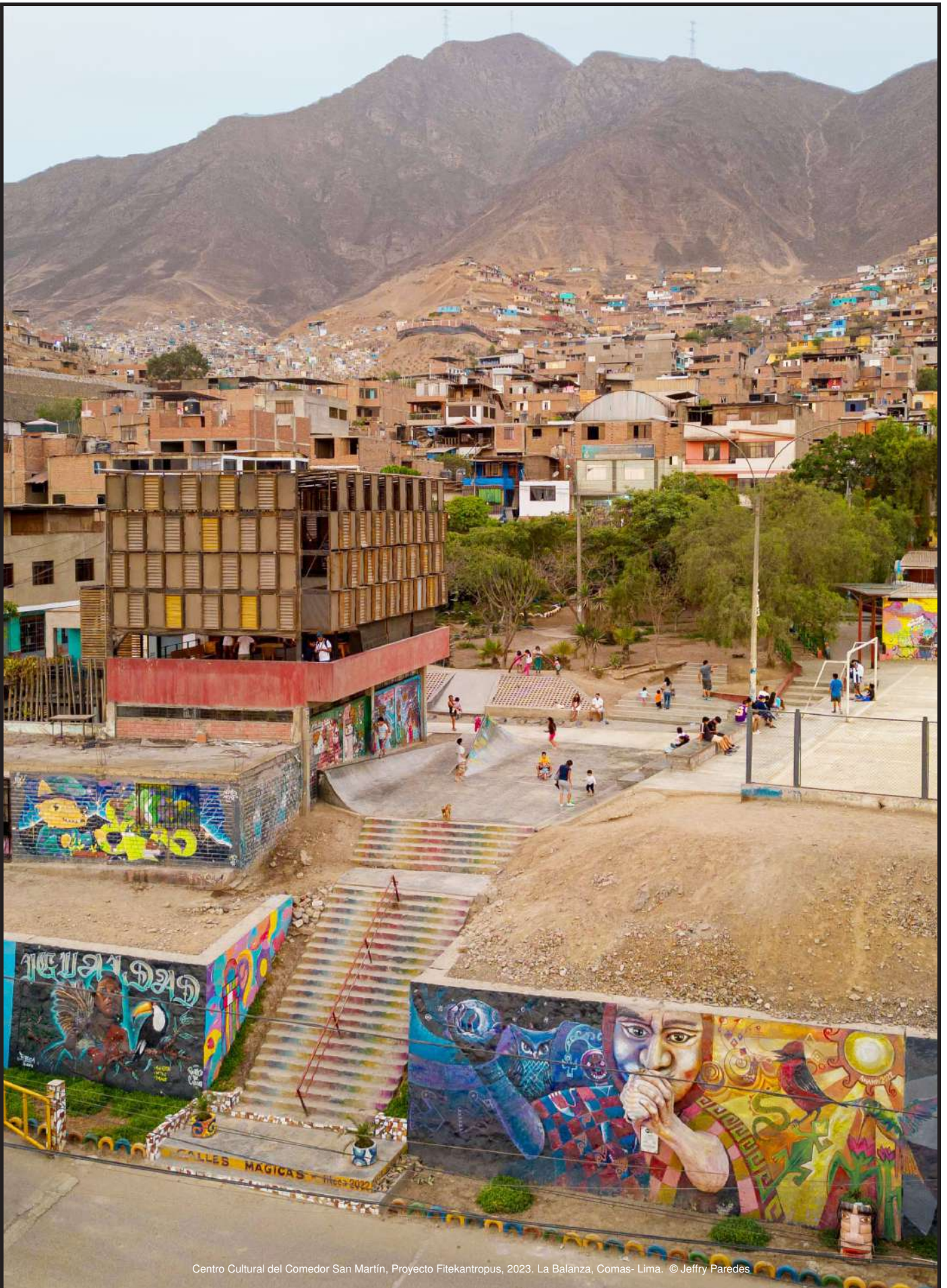
Centro Cultural del Comedor San Martín, Proyecto Fitekantropus, 2023. La Balanza, Comas- Lima.